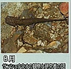
8月 サンショウウオの観察と研究者の話