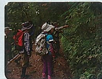
セラピーロードで野草と昆虫観察