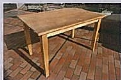
ダイニングテーブル