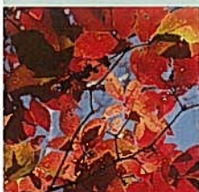
10月 三頭山のカエデ観察と広葉樹講座