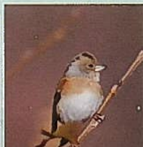
2月 冬鳥ウォッチング