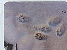
セラピーロードで バードウォッチングと足跡観察