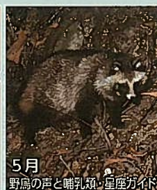
5月 野鳥の声と哺乳類・星座ガイド