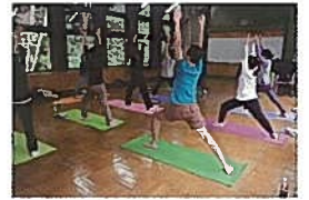
森林セラピーとヨガ体験教室