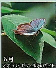
6月 オオルリとゼフィルスのガイド