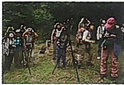
新緑の檜原・奥多摩バードウォッチングを楽しもう