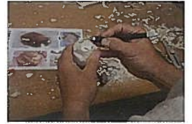
アニマルカービング教室