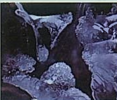
1月 カメラ講座 (氷を撮ろう)