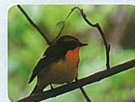
セラピーロードで バードウォッチングと野草観察