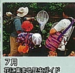
7月 花に集まる昆虫ガイド