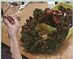
12月 モミの葉でクリスマスリース作り