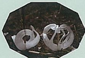
氷花とバードウォッチング