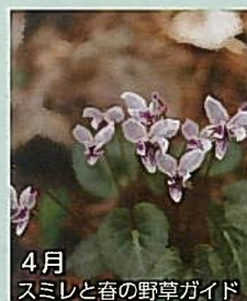
4月 スマレと春の野草ガイド