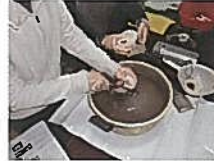
田舎コンニャク作り体験