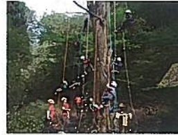
ツリークライミング教室