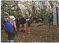
秋の檜原・奥多摩自然散策