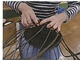
つるカゴ作り教室