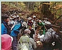
11月 木の実とカエデと紅葉ガイド