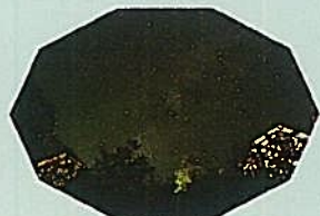
夏の星座と哺乳類ガイド