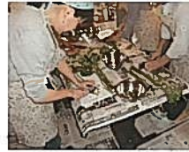
檜原ワサビ漬け作り体験