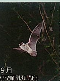
9月 小型哺乳類講座