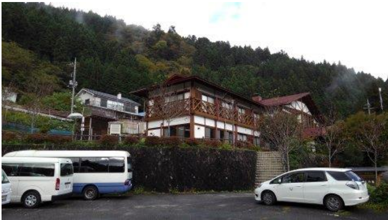
奥多摩都民の森 柗寄森の家