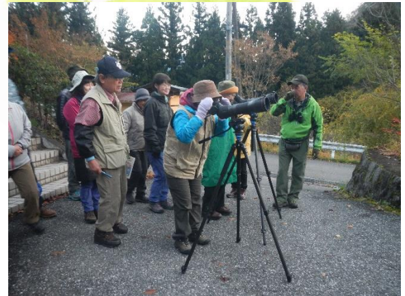
早朝バードウォッチング