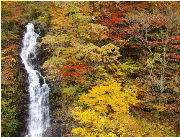
紅葉した三頭大滝