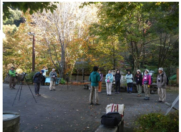
山のふるさと村でゆっくり自然散策